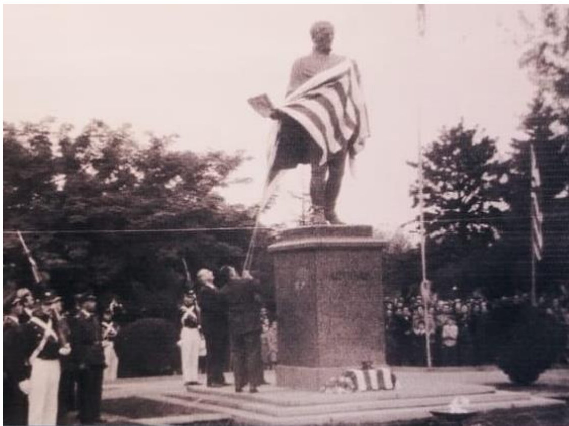
Figura 1: Inauguración de la escultura año 1953.

pintura lo desconcertará porque no puede tocar los objetos representados” (GOMBRICH,2003; p137-138). De esta manera los individuos interpretarán la figura y la importancia del prócer en el discurso de los estados-naciones.