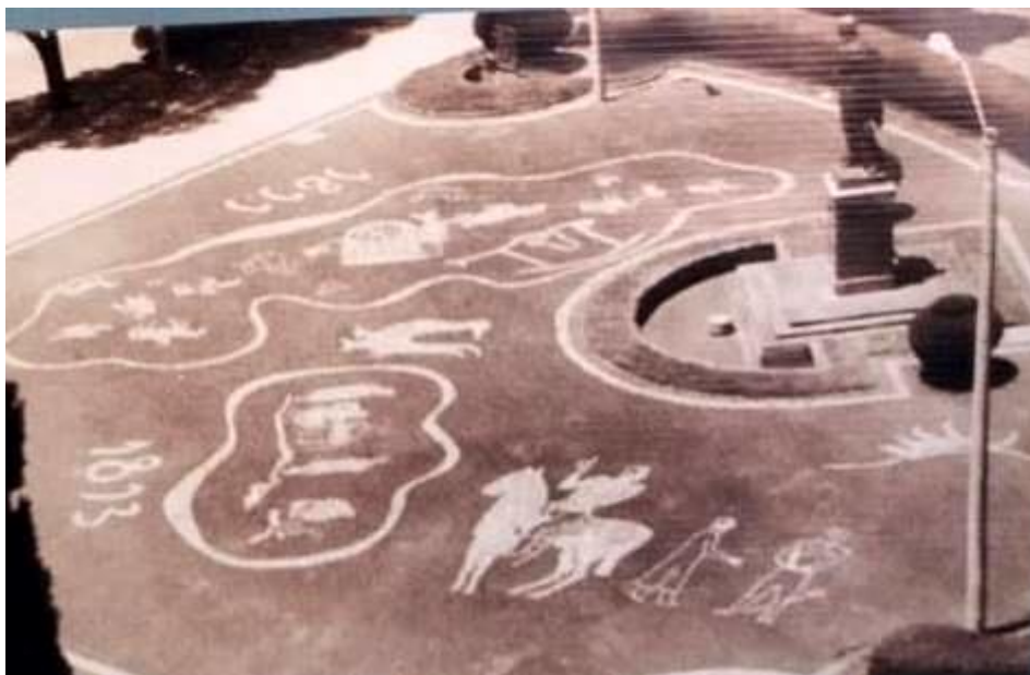
Figura 2. Rincón de la Patria. Archivo de la Imagen. Museo del Patrimonio Regional. IDR